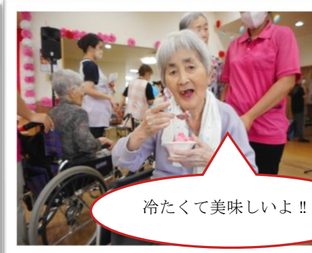
冷たくて美味しいよ!!